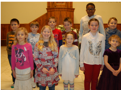
Kinder der Schulhäuser Buchserbach, Grof und Kappeli