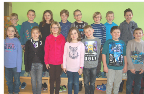
Kinder der Schulhäuser Räfis und Hanfland